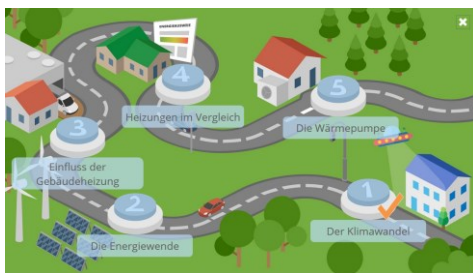
Abb.: Beispiel Hauptmenü in Modul 1 (Kapitel 1 abgeschlossen)

Vollständig bearbeitete Kapitel werden durch einen Haken gekennzeichnet.